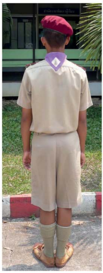
ถุงเท้ายาวสีกากี พับลงมา ประมาณ 2 นิ้ว