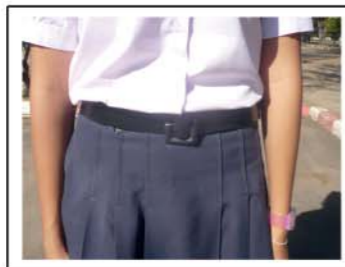
เสื้อใส่ในกระโปรงมองเห็นเข็มขัด