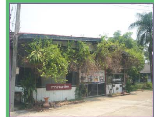
อาคารเรียนงานเกษตร