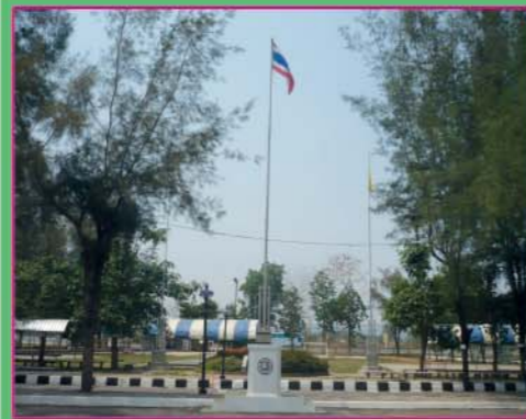
สถานที่เข้าแถวหน้าเสาธง