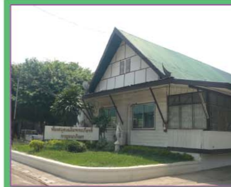
อาคารห้องสมุด