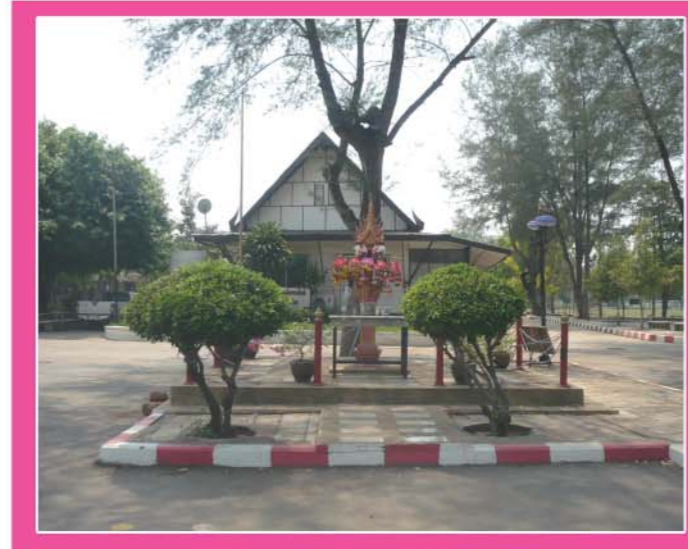
ศาลพระภูมิโรงเรียนเมืองเซลียง