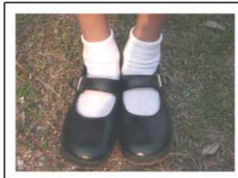
ถุงเท้าแบบยาวพับ 2 ท่อน