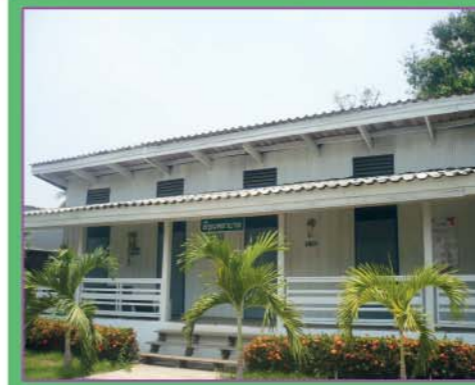
อาคารพยาบาล