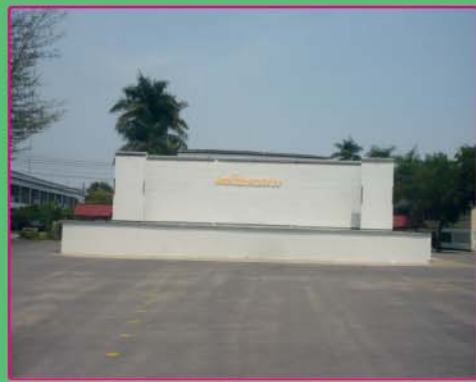
เวทีทำกิจกรรม