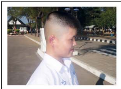
ด้านข้าง