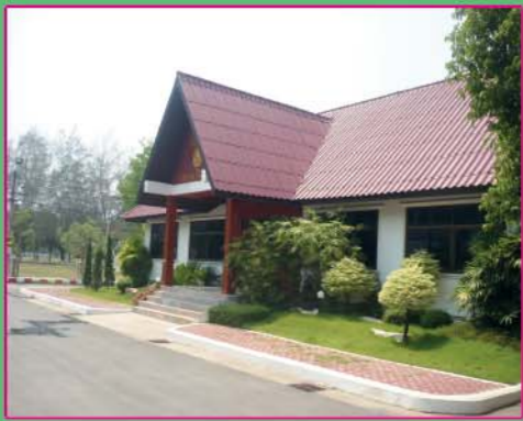
อาคาร 50 ปี