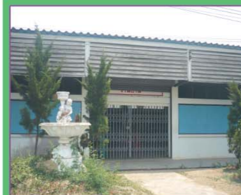
อาคารเรียนงานอาหาร