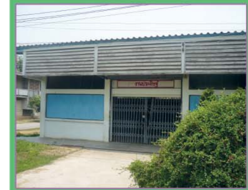
อาคารเรียนงานบ้าน