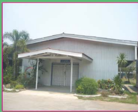
อาคารเรียนงานธุรกิจศึกษา