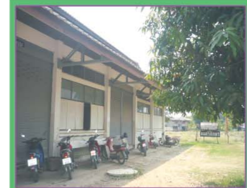
อาคารฝึกงานและห้องดนตรีสากล