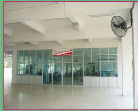
ห้องศูนย์เพื่อนใจวัยรุ่น