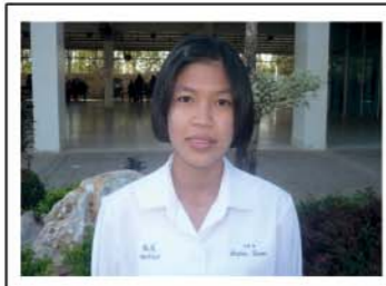
ตัดผมสั้นแนวเหลี่ยมคาง