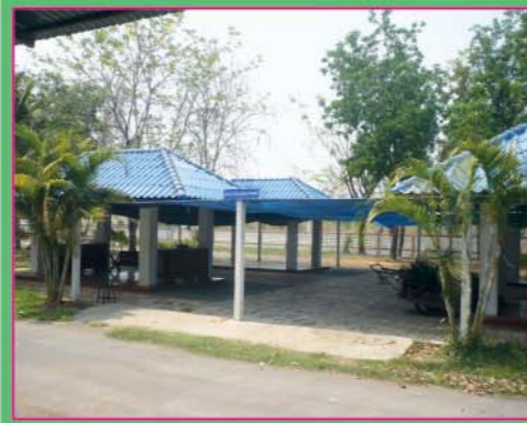
สถานที่พักผ่อนศาลาทรงคุณ