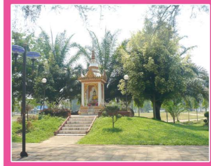
พระพุทธรูปเมืองเซลียง