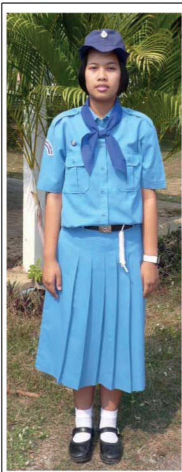
เสื้อ กระโปรง เข็มขัดและ การประดับเครื่องหมาย